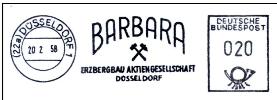
oben: Freistempel eines Bergbau-Unternehmens

In keinem schlesischen Zechenhaus fehlte der Barbara-Altar. In manchen Gruben, so z.B. im Carsten-Zentrum in Beuthen, war sogar ein Altar unter Tage anzutreffen. Die Barbara-Altäre, wie sie im ganzen Industriegebiet Schlesiens vorhanden waren, waren immer reichlich geschmückt, besonders aber in den Zechenhäusern, wo die Heiligenfigur von einem Kohlengebilde umrahmt wurde. Diese sollte an die Grube unter Tage erinnern. In den Gotteshäusern war es ebenso. Die älteste Barbara-Kirche Schlesiens stammt aus dem 13. Jahrhundert und steht in Breslau.