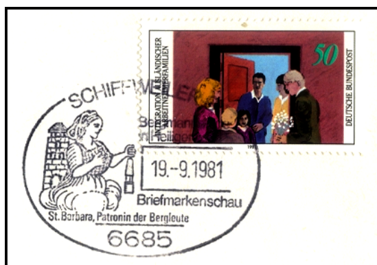
links: Sonderstempel „Bergmannstage in Heiligenwald“ (Ortsteil von Schiffweiler im Saarland)