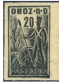
Lagerpostmarke vom 19.12.1944 aus dem Kriegsgefangenen - Offizierslager Groß-Born in Westpommern zu Ehren der Hl. Barbara, Schutzpatronin der Artilleristen