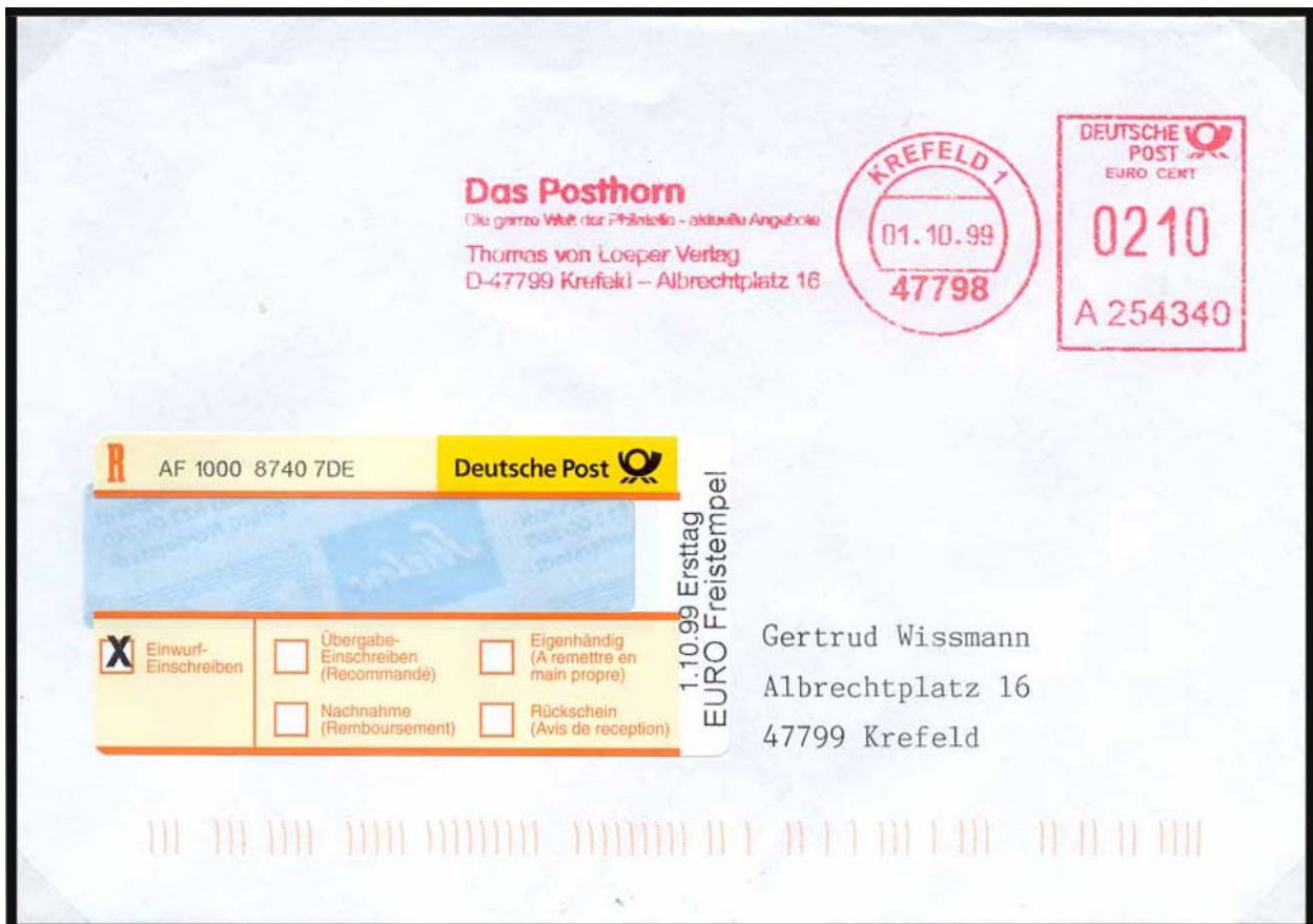
Abb. 5: Ein Krefelder Händler, Spezialist für moderne Postgeschichte, war Initiator eines Sonder-R-Labels zum offiziellen Ersttag.