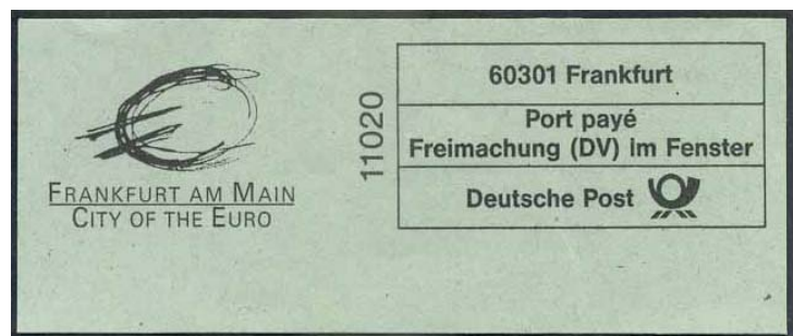
Abb. 2: Zudruck „FRANKFURT AM MAIN – CITY OF THE EURO“ auf Brief mit EDV-Freimachung