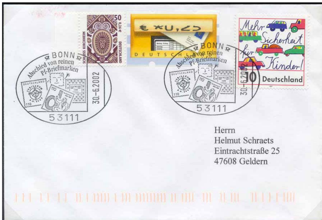
Abb. 18: Währungs-MiF mit reiner Pf.-Sondermarke (10 Pf.), Dauermarke mit Doppelnominale (50 Pf. bzw. 0,26 €) und Euro-ATM (Restwert zu 0,25 €), was einem Gesamtentgelt von 0,56 € oder 1,09 DM (1 Pf. zu wenig) entspricht. Zum Abschied von den reinen Pf.-Briefmarken kam in Bonn ein weiterer Besonderer Stempel zum Einsatz.

Die Aufbrauchfrist für Postwertzeichen in Pf.-Nominale wurde von der Post großzügig gehandhabt. Durch eine interne Regelung wurde sie bis zum 6.7.2002 verlängert, so dass bis zu diesem Stichtag für entsprechende Frankaturen kein Nachentgelt erhoben wurde. Örtlich wurde sogar noch großzügiger verfahren, wie der im Ausschnitt gezeigte Brief vom 8.7.2002 belegt (Abb. 17).