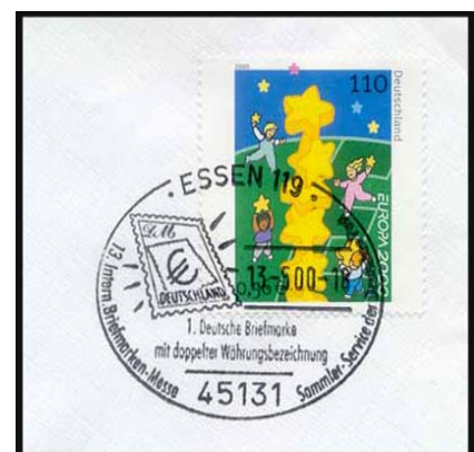
Abb. 10: Handwerkbestempel zur Briefmarkenmesse in Essen, der auch als Ersttagsstempel in Betracht kam