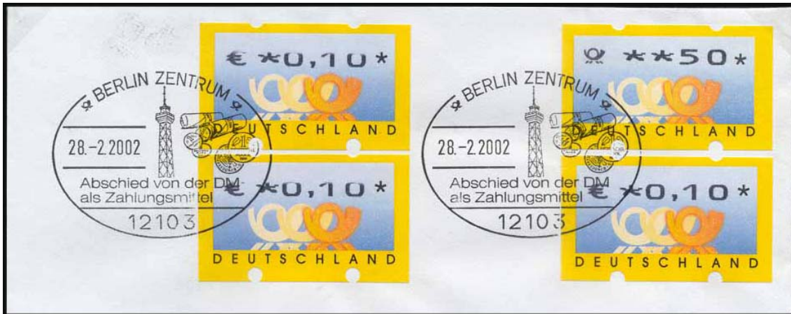
Abb. 14: Besonderer Stempel der NL Berlin Zentrum zum Abschied von der DM als Zahlungsmittel auf Brief mit ATM-Mischfrankatur DM/Euro

Zwei Monate dauerte in Deutschland die Übergangszeit, in der der Handel DM und Euro als Zahlungsmittel akzeptierte. Postgeschichtlich ist dieses Datum weniger bedeutend, da alle Postwertzeichen in Pf.-Währung noch weitere vier Monate lang frankaturgültig blieben.