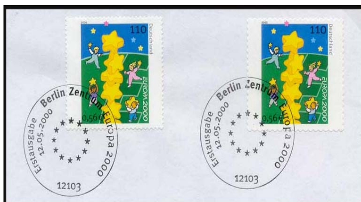
Abb. 9: FDC (Ausschnitt) mit Bogen- und Heftchenmarke sowie Ersttags-Sonderstempel Berlin, bei dem jedoch jeglicher Hinweis fehlt, dass es sich um die erste deutsche Marke mit Doppelnominale handelt