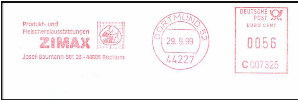
Abb. 4: Einige Firmen, die es besonders eilig hatten, verwendeten die neuen Stempelklischees bereits vor dem Stichtag.

Viele der etwa 300 000 Firmen mit Absenderfreistempeln allein in Deutschland wären hoffnungslos überfordert gewesen, wenn sie ihre Geräte erst zum Jahreswechsel 2001/ 02 von DM auf Euro hätten umstellen müssen. Daher erlaubte die Deutsche Post die Verwendung von Euro-Klischees schon vom 1.10.1999 an. Wer die Umrüstung bis Mitte 2000 vornehmen ließ, erhielt sogar Prämien vom Gerätehersteller und von der Post.