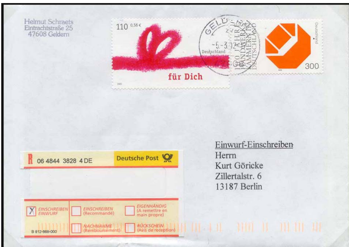
Abb. 15: Das Entgelt für das Einwurf-Einschreiben betrug 2,10 € (früher 4,10 DM). Addiert man die in Euro umgerechneten Nominalen der Einzelmarken (0,56 € und 1,53 € = 2,09 €), ergibt sich ein Fehlbetrag von 1 Cent.

In den ersten sechs Monaten nach der Euro-Bargeldeinführung wurden große Mengen älterer Marken in Pf.-Nominale aufgebraucht, darunter viele, die schon seit über 30 Jahren nicht mehr frankaturgültig waren. Beim Verkleben mehrerer Pf.-Marken oder bei Mischfrankaturen von Pf.- und Euro-Marken konnten Rundungsdifferenzen auftreten, die an den Postschaltern für manche Verwirrung sorgten, meist aber großzügig gehandhabt wurden.