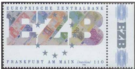
Abb. 1: Deutsche EZB-Sondermarke vom 16. Juli 1998

In Frankfurt/Main wurde die Europäische Zentralbank als Hüterin des Euro gegründet. Sie wacht als unabhängige Institution darüber, dass der Euro eine stabile Währung bleibt und auf Dauer seinen Wert behält.