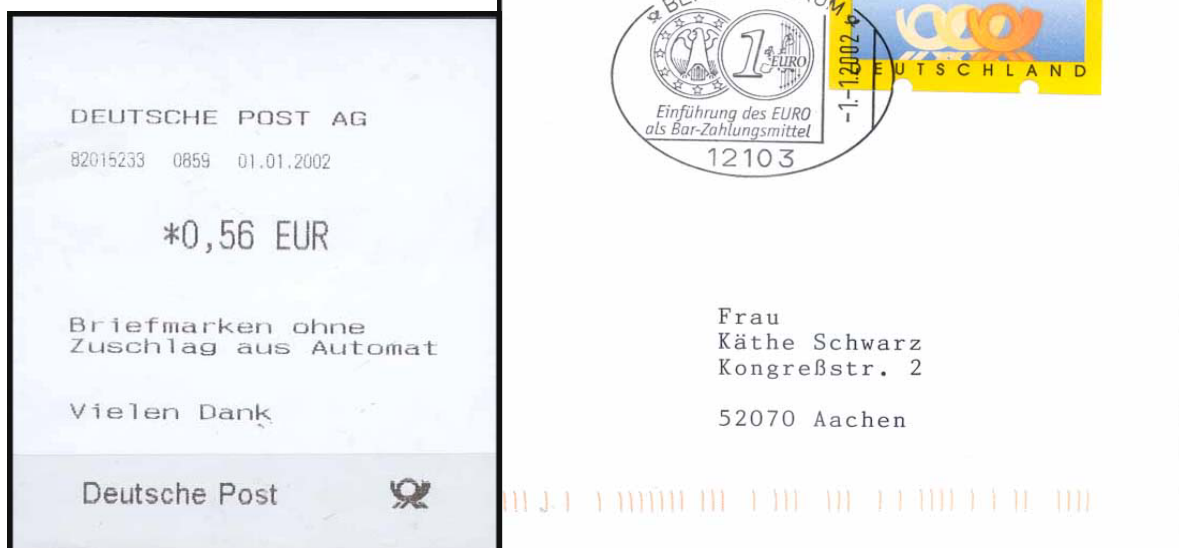
Abb. 13: FDC (Ausschnitt) mit Euro-ATM und zugehöriger ATM-Quittung; Besonderer Stempel der Niederlassung Berlin-Zentrum zur Euro-Bargeldeinführung