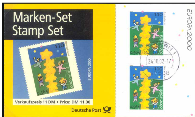
Abb. 8: Die Inschrift des Heftchendeckels war zweisprachig, kurioserweise fehlte jedoch der Verkaufspreis in Euro.