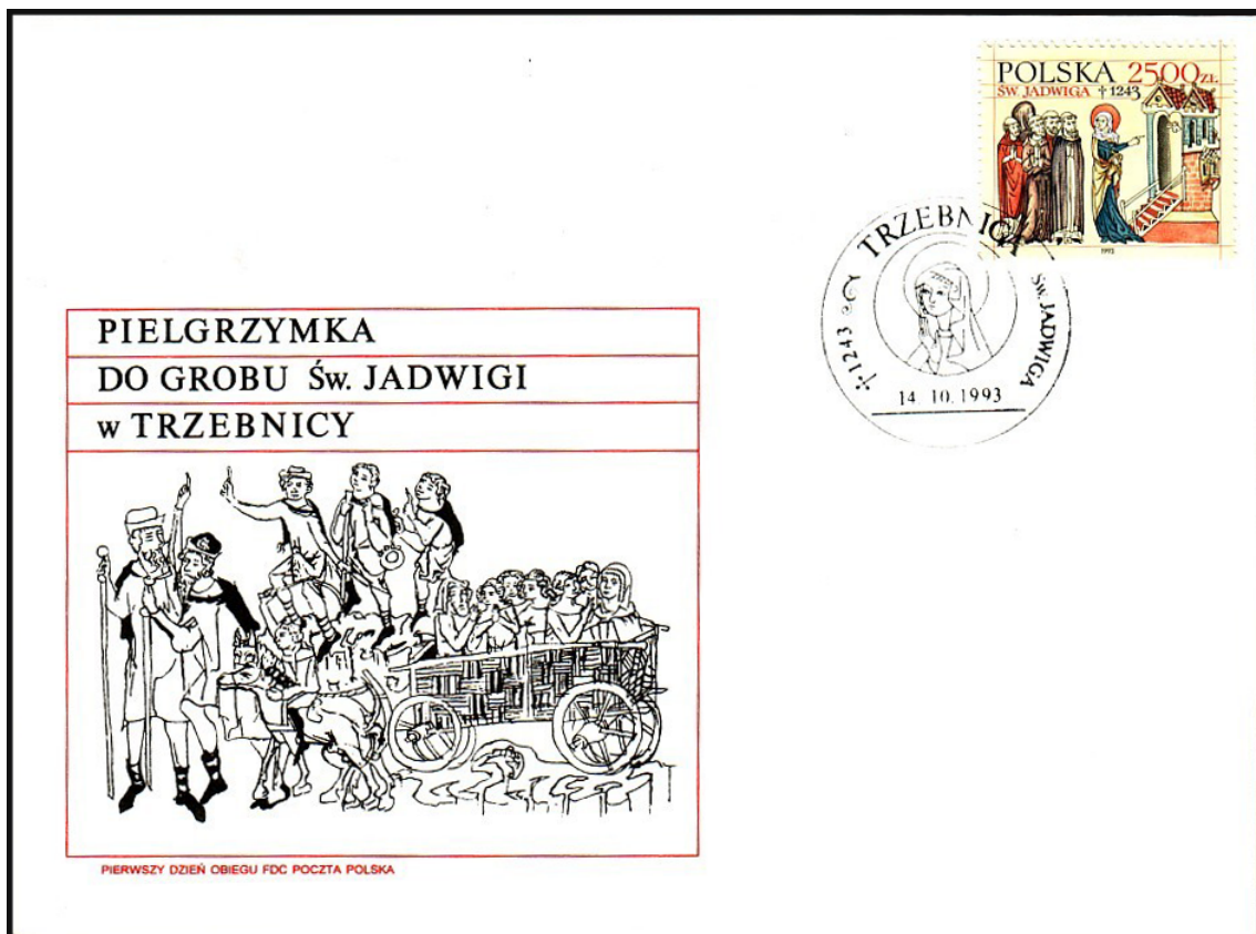
FDC der polnischen Gedenkmarke zum 750. Todestag der heiligen Hedwig mit Ersttags-Sonderstempel Trzebnica (Trebnitz), wo sie begraben ist; die Illustration auf dem FDC zeigt Pilger zum Grab der hl. Hedwig in Trebnitz.

Schon kurz nach Ihrem Tod muss die Verehrung Hedwigs eingesetzt haben. Bereits 1267 wurde sie von Papst Klemens IV. heilig gesprochen. Um 1300 entstand eine ausführliche Vita. Nicht nur die späteren schlesischen Herzöge, sondern auch Kaiser Karl IV. wirkten an der Verbreitung des Kultes mit. Nach einer Phase der Vergessenheit, die durch die Reformation angeleitet war, wurde der Hedwigskult in den zwanziger Jahren des 20. Jahrhunderts vom Breslauer Kardinal Bertram wiederbelebt. Weitere Impulse erhielt der Hedwigskult nach 1945, als Hedwig zur wichtigsten Patronin der vertriebenen deutschen katholischen Schlesier wurde. Aber er hat sich auch unter der polnischen Bevölkerung Niederschlesiens verbreitet. Sie ist die Patronin von Schlesien und der Diözese Görlitz.